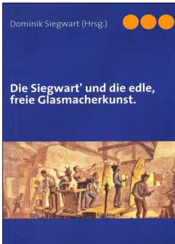
Abb. 2009-1/455 Dominik Siegart Die Siegart' und die edle, freie Glasmacherkunst, Einband Verlag BOD GmbH, Norderstedt 2009

Die Erforschung der Familiengeschichte in der Vergangenheit, S. 20-25